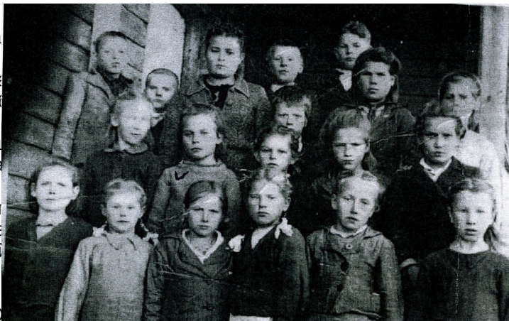
Моя бабушка в четвертом классе. 1949 год.

После войны жилось очень трудно, но дети помогали взрослым строить мирную жизнь.